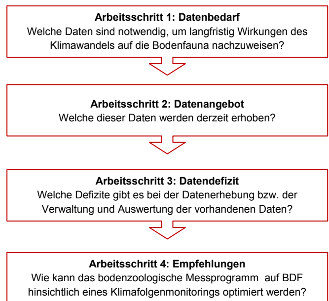
Abb. 1: Schematischer Arbeitsablauf im BOKLIM-Projekt (Teil Bodenzoologie)

Im Folgenden werden die Ergebnisse des Projektteils „Bodenzoologie“ vorgestellt. Die Arbeitsschritte sind in Abb. 1 dargestellt. Es zeigte sich, dass die Boden-Dauerbeobachtung das einzige Messprogramm bundesweit ist, in dem bodenzoologische Daten in einem Umfang erhoben werden, der die Bezeichnung „langfristiges Monitoring“ rechtfertigt. Die Arbeitsschritte 2-4 konzentrierten sich daher auf die Boden-Dauerbeobachtungsflächen (BDF).