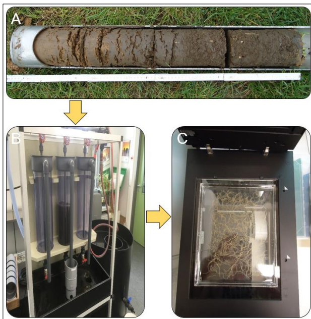
Abbildung 1: Abfolge der Untersuchungsmethode zur Bestimmung der Durchwurzelung von Winterweizen im Feld. A: Bodenmonolith; B: Wurzelwaschung; C: Wurzelscanner.

Wurzeln mit Hilfe der Bildanalysesoftware WinRHIZO® (Regent Instruments Canada Inc., 2013) digitalisiert (Abb. 1C) und die Wurzellängendichten (WLD) quantifiziert. Der Prüfgliedervergleich erfolgte über einer Varianzanalyse (F-Test) der Mittelwerte ( p < 0,05 ).