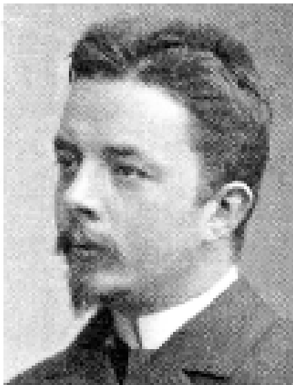
Abb. 1 Eilhard Mitscherlich als junger Dozent