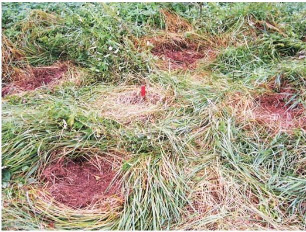
Abb. 3: „Subsampling“-Design

Die Proben wurden getrocknet, gesiebt und mit Hilfe der optischen Emissionsspektrometrie (ICP-OES) auf die Schwermetalle Cd, Cr, Cu, Ni, Pb and Zn untersucht.