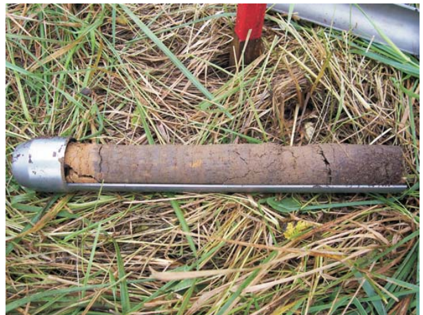
Abb. 1: Probenahme mit Split-Tube-Sampler

Für die Untersuchungen wurde auf einem ehemaligen Rieselfeld südlich von Berlin eine Fläche von 3700 m 2 ausgewählt. Diese Fläche wurde unter Zugrundelegung eines Rasters von 7,5 x 5 m unterteilt und mit Hilfe eines speziellen Probenstechers (Abb. 1) bis zu einer Tiefe von 20-30 cm systematisch beprobt.